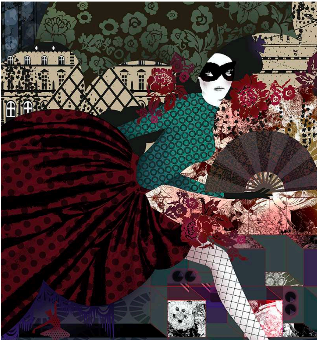
Estratto dell'affresco immaginato da Wanders per Roche Bobois (illustrazioni delle città di Londra, Parigi e Istanbul). Grafiche riprese sui tappeti, sui cuscini e all'interno delle credenze Wonder Cabinet.

E proprio qui, in un sofisticato spazio situato in via Solferino 31, che la Maison svelerà in anteprima mondiale – dal 16 al 22 aprile - la nuova collezione Globe Trotter immaginata dal designer olandese Marcel Wanders . Marcel Wanders è considerato uno dei designer più sorprendenti della sua generazione; le sue creazioni sono esposte nei musei più prestigiosi del mondo come il MoMA di New York e di San Francisco, il V&A Museum di Londra e il museo Stedelik di Amsterdam. Dal 2001 è cofondatore e direttore artistico del marchio olandese MOOOI.